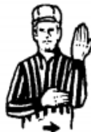
Illegal Offensive Screening - Illegal Pick