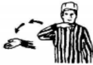
Re-entry of the Crease