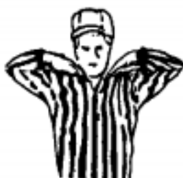
Illegally Touching the Ball