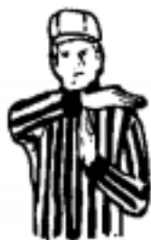
Tech Foul - 30 secs