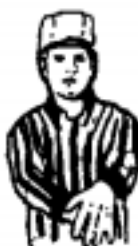
Withholding the Ball