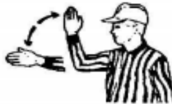
Out of Bounds Direction of Play