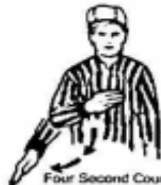
Four Second Count