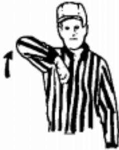
Illegal Body Check